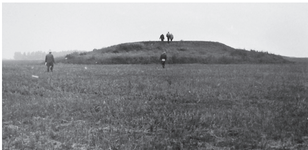
Рис. 1. Курганный могильник Андроново-I (Андроново-5), 1974 г.;