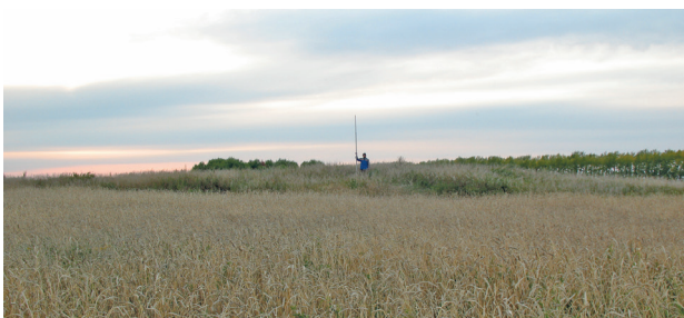
Рис. 2. Курганный могильник Андроново-I (Андроново-5), 2009 г.