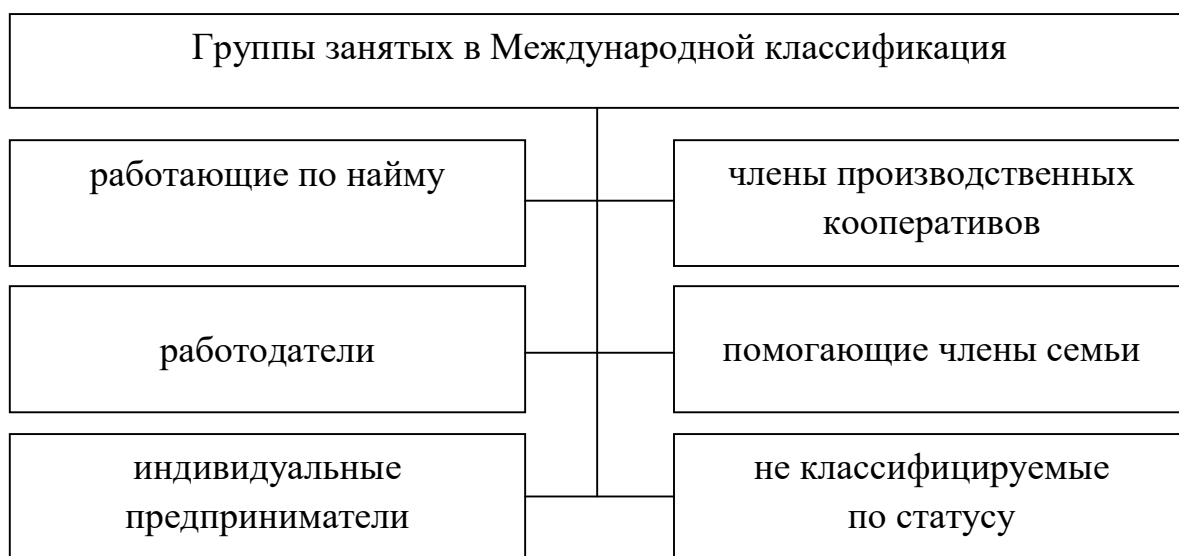
Рисунок 2 – Выделенные группы занятых в Международной классификация статуса занятых

Особенность этих видов занятости в том, что они выступают фактором, как экономической, так и социальной жизни общества. Одним из основных преимуществ занятости является то, что занятость оказывает влияние на то, чтобы не допустить застойный характер занятости.