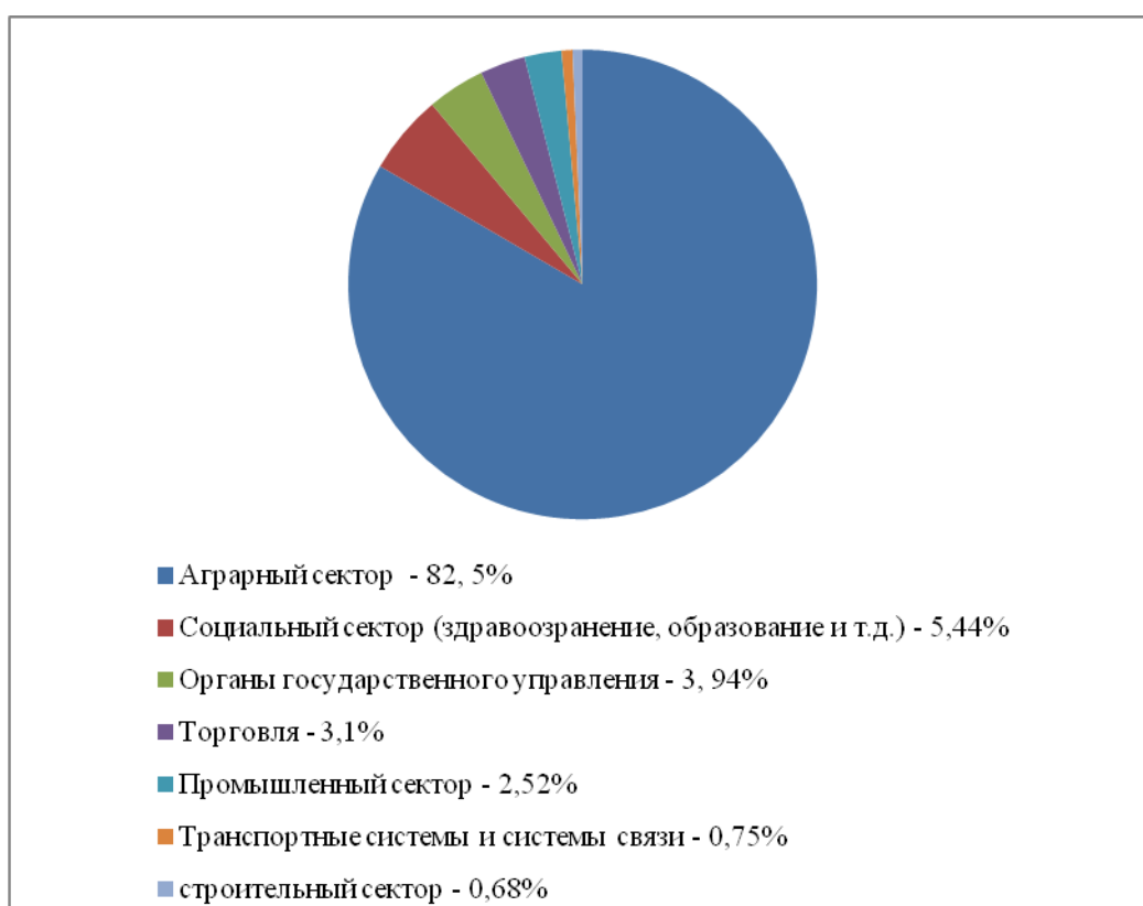
Диаграмма 2. Сфера занятости казахского населения КНР 101

Исходя из этого, можно сделать вывод, что подавляющее большинство казахов Китая заняты в аграрном секторе, это можно объяснить районом их проживания. Синьцзян не является одной из наиболее развитых провинций в Китайской Народной Республике, процесс развития