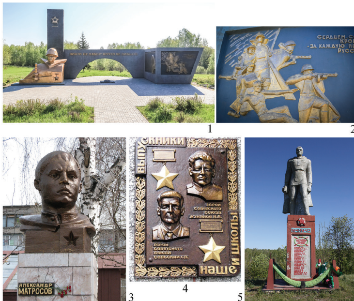
Рис. 2. Произведения А.И. Жневского Fig. 2. The works of A.I. Zhnevsky

В монументальности комплекса, насыщенности его различными элементами, в несоразмерности размеров бюста солдата и намеренно яркой героизации сцены боя на барельефе чувствуется стремление автора максимально подчеркнуть величие и значимость совершенного подвига, вечную печаль и память о погибших.