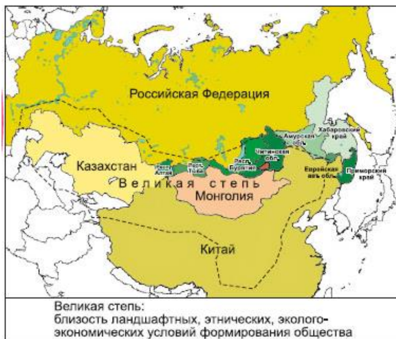
Рис. 2. Великая степь (Приграничные и трансграничные территории Азиатской России, 2010)

События, связанные с Великой степью, среди которых главное место занимают завоевания Чингисхана, сильно повлияли на расселение народов Центральной Азии и, как следствие, на формирование государств и границ между ними.