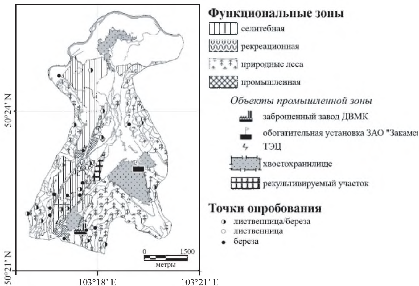
Рис. 1. Карта точек опробования с функциональным зонированием г. Закаменска.

рья на приборах Elan-6100 и Optima-4300 ("Perkin Elmer", США). Для подробного анализа выбрано 16 приоритетных загрязнителей, типичных для Mo-W месторождений (Геохимия..., 1990) и обладающих высокой токсичностью для живых организмов. Они относятся к I (Zn, As, Pb, Cd), II (Cr, Co, Ni, Cu, Mo, Sb), III (V, Sr, Ba, W) классам опасности, кроме того, рассмотрены Sn и Bi.