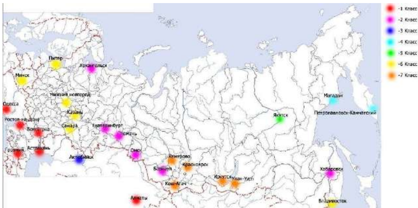
Рисунок 2 – Пространственное распределение динамических рядов среднесуточных температур за 1974 год

В итоге авторами отмечено, что пространственно-временной анализ динамических рядов существенно упрощается при использовании результатов совместной кластеризации объектов типа «город-год» (позволяет сократить возможные варианты перебора при сравнении и даже увидеть картинку по годовой динамике в целом).