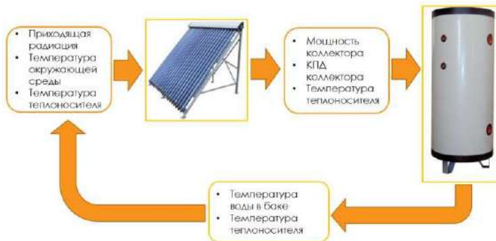
Рисунок 1 – Структурная схема модели солнечного теплоснабжения

Структурная схема модели представлена на рисунке 1. На рисунках 2 и 3 приведены графики, построенные по результатам расчетов модели: температура окружающего воздуха в течение дня изменялась от 7°C до 15°C, бак находился в помещении при температуре окружающего воздуха 25 °C, плотность потока солнечного излучения вычислялась в условиях ясного неба.