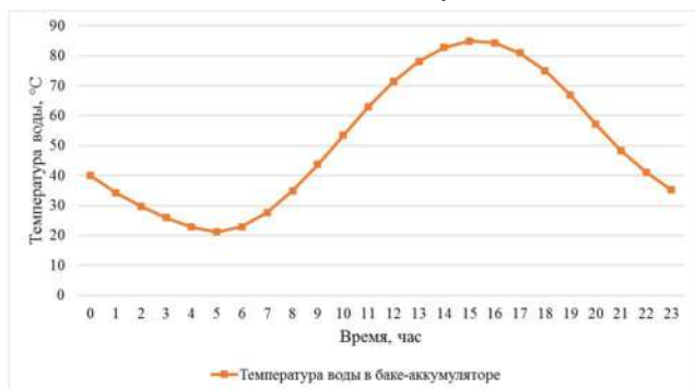
Рисунок 3 – Изменение температуры воды в баке-аккумуляторе в течение дня

В заключение отметим, что природно-климатические условия Казахстана (более 300 солнечных дней в году) позволяют использовать энергию солнца для покрытия значительной доли потребностей в тепле. Системы солнечного теплоснабжения могут дать экономию 25-30% годового расхода топлива на теплоснабжение, а для системы горячего водоснабжения до 50-70%. Эффективное использование солнечных систем теплоснабжения в Республике Казахстан позволит существенно улучшить экологическую обстановку, сократить эмиссию парниковых газов и значительно снизить затраты на топливо.