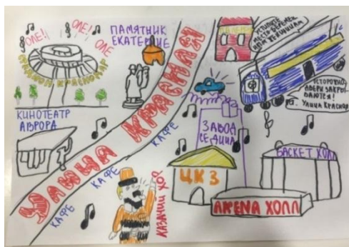
Рис. 5 «Цветовая колористика г. Краснодара»