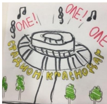
Рис.4. «Стадион ФК Краснодар»