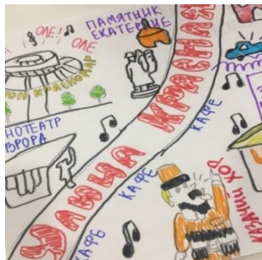
Рис. 2. «Улица Красная»