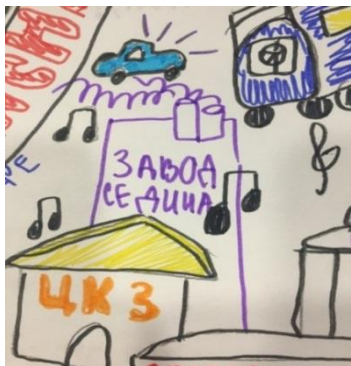
Рис. 1. «Завод имени Седина и ЦКЗ»