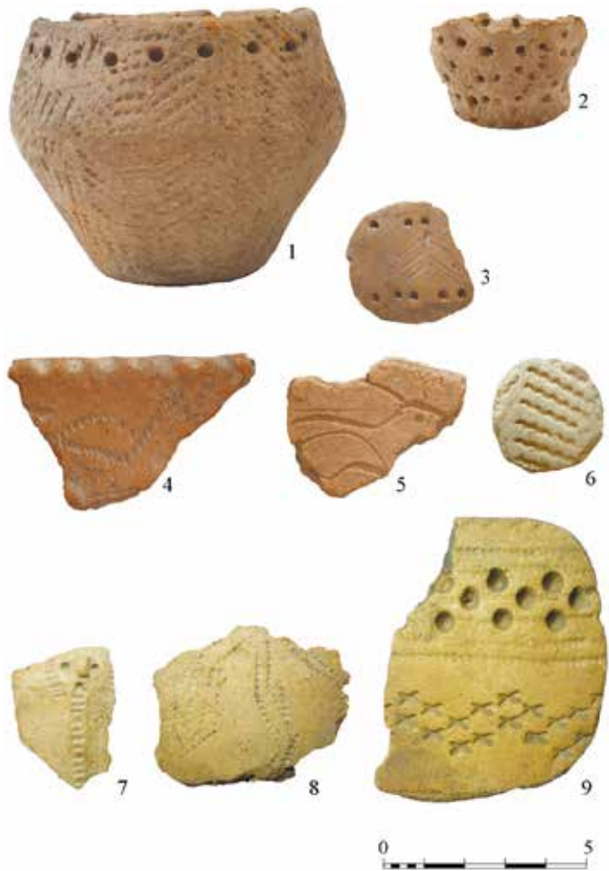
Рис. 2. Поселение Тух-Сигат-IV. ТОКМ №11050. Керамический инвентарь энеолита–эпохи бронзы

В целом, как отмечает Ю.Ф. Кирюшин, материалы поселения Тух-Сигат-IV отражают культурно-хронологические этапы развития таежного населения от позднего неолита (раннего энеолита) до раннего железного века. Стратиграфические и планиграфические наблюдения позволили выделить в культурном слое поселения несколько хронологически различающихся слоев. Так, в верхней части культурного слоя залежали фрагменты сосудов эпохи раннего железа, скопления и отдельные фрагменты молчановской керамики. Ниже по всей площади залегания располагалась керамика еловской культуры и периода развитой бронзы. В нижней части культурного слоя была сосредоточена в основном керамика позднего неолита и эпохи раннего металла, украшенная отпечатками «отступающей лопаточки», палочки, крупнозубой «гребенки», гладкой и зубчатой качалки [Кирюшин, 1972; 1983, с. 201].