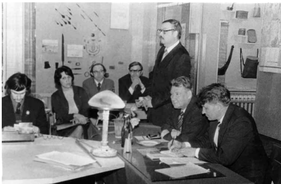
Фото 10. Третье археолого-этнографическое совещание. Томск, 1975 г.

3. Книга является пионерским образцом успешного применения естественно-научных методов при изучении археологических памятников. При реконструкции окружающей среды были использованы разнообразные практики и принципы геоархеологии задолго до того, как эта дисциплина утвердилась в отечественной науке.