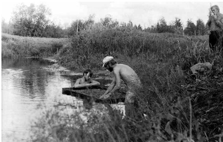
Фото 8. Тух-Эмтор, 1974 г.