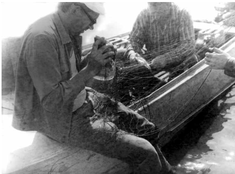
Фото 5. Рыбак. На оз. Малгет, июль 1974 г.