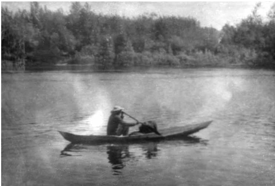
Фото 4. На обласке по Васюгану. 1968 г.

Итоговые результаты стажировки не только внушали персональный оптимизм, но открывали новые перспективы для развития археологиче-