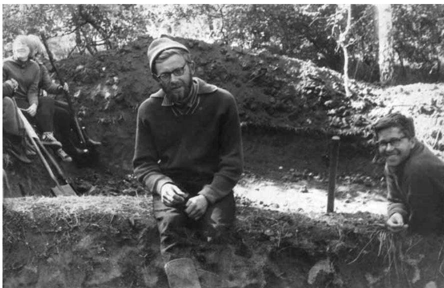
Фото 1. Первая экспедиция. Рёлка, 1966 г.