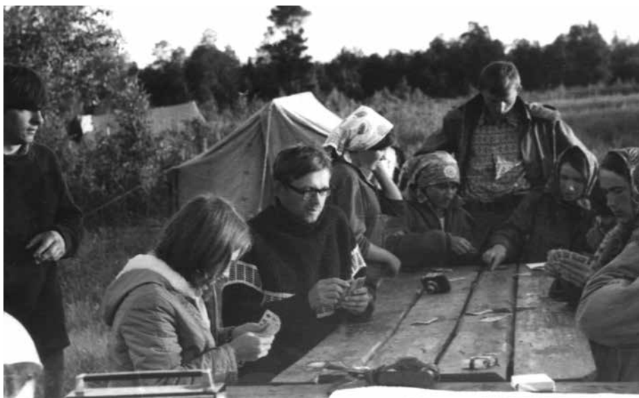
Фото 7. Карточный турнир. Малгет, 1975 г.

ходимыми. Шли два дня с ночевкой в охотничьей избушке. К счастью, было тепло и гнус еще не поднялся. На подходе к конечной цели путешествия столкнулись с редким в этих местах оптическим явлением, чем-то вроде миража. Это настолько смутило проводников, что они перепутали ориентиры. С двумя хантами заблудиться в лесу невозможно, но поплутать пришлось, что окончательно измотало и без того уставших путников. Через 3 года экспедиционная судьба провела меня по этому маршруту, и это было одним из тяжелейших испытаний в моей жизни.