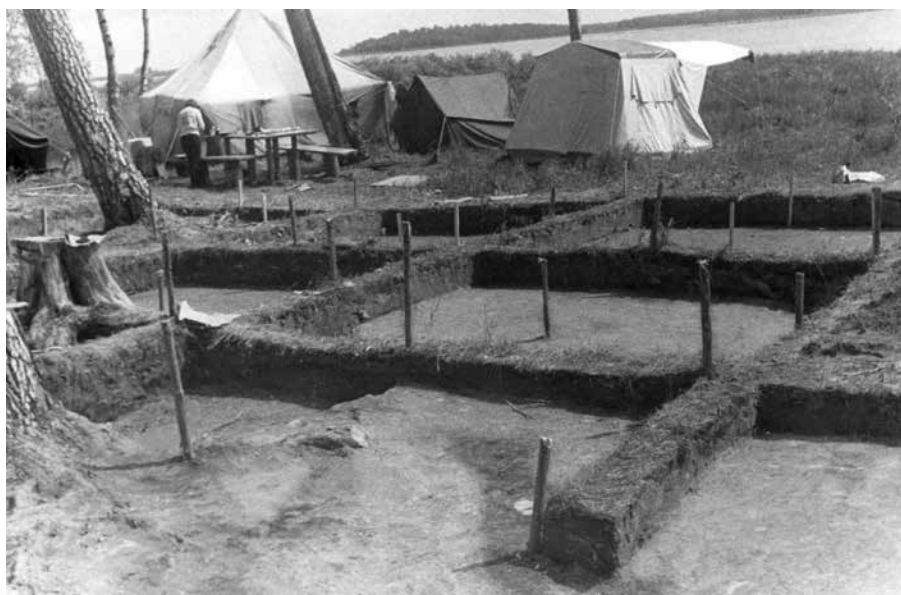
Фото 6. Малгетская эпопея. МАП-72, р. 3

Озерного около 30 километров по прямой, по таежной тропе значительно больше. Да и цена этих километров особенная: значительная часть маршрута проходила через болота, а они в это время года наполняются талыми водами и становятся труднопро-