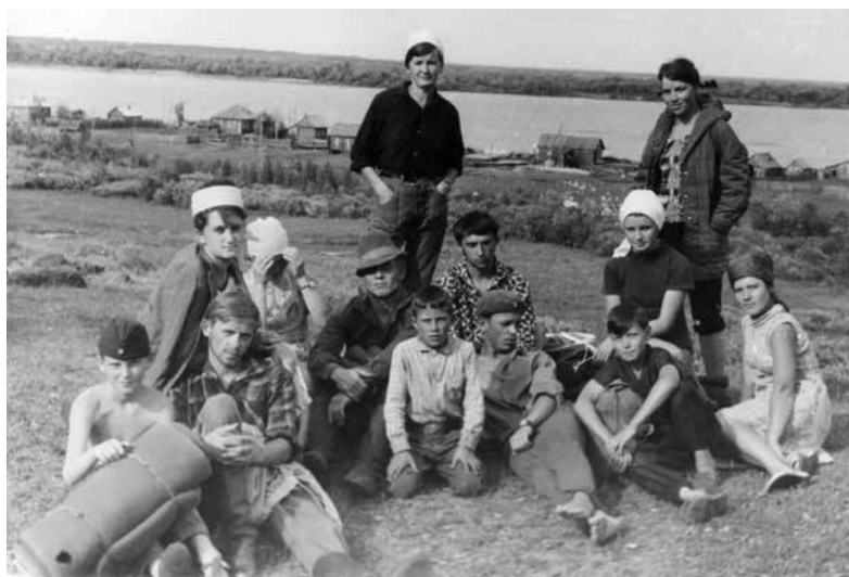
Фото 2. На память о Молчаново. 1966 г.

чертить планы, отвечать за работу бригады. Так, исподволь, без специальных тренингов и занятий накапливался необходимый опыт, нарабатывались профессиональные навыки и умения.