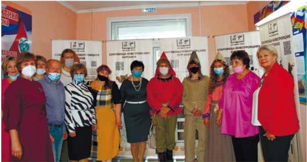
Рис. 1. Фотонатурные реконструкции одежды населения Верхнего Приобья эпохи раннего железа на открытии фотовыставки «Сокровища Новотроицких курганов»