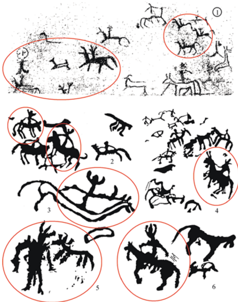
Рис. 1. Наскальные изображения «трехрогих» всадников в Китае:

всадников и один стоящий (или сидящий) человек изображены в специфических головных уборах, напоминающих корону с тремя зубцами. Один всадник, расположенный в центральной части западной плоскости, «скачет» в левую сторону. Три других всадника выбиты правее него, в правом верхнем углу, и тоже «скачут» влево. Пятый всадник в трехрогом головном уборе, тоже едущий влево, находится в левой части западной плоскости, ниже антропоморфного персонажа с большой круглой головой. Изображение пятого всадника сохранилось плохо, особенно задняя часть фигуры